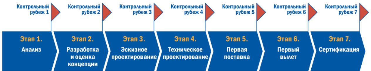
Рис. 1.7. Этапы разработки КБО.

Создание КБО разбито на семь этапов . Назначением каждого этапа является продвижение разработки КБО вперед от одного контрольного рубежа до другого после успешного завершения определенных работ. Деление проекта КБО на этапы является основным вкладом в общее управление рисками. Этапы разработки КБО с контрольными точками показаны на рис. 1.7.